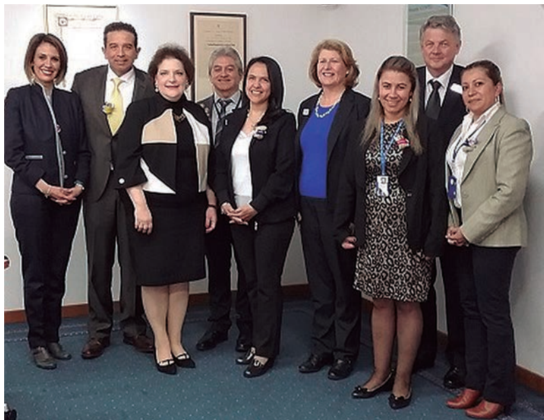
El Sistema de Acreditación en Salud de Colombia, liderado por ICONTEC, obtiene nuevamente la acreditación internacional de ISQUA.

Es importante que los ciudadanos conozcan estos esfuerzos de ICONTEC, pero sobre todo de las instituciones prestadoras de servicios de salud que han apostado por mejorar sus prácticas clínicas, invertir recursos en infraestructura, personal, tecnología, procesos y demás requerimientos de los estándares. Es esencial que las entidades responsables de